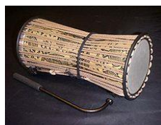
Un tama ou tambour parlant.