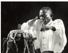
Doudou N'diaye Rose

Les instruments africains entendus sont des sabar traditionnels , ainsi que ses nombreuses variantes (saourouba, assicot, bougarabou, meung meung, lamb, n'der, gorom babass et khine).